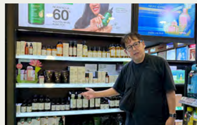
国内・海外と幅広い現場を訪問、 消費行動の多様性を発信しています。