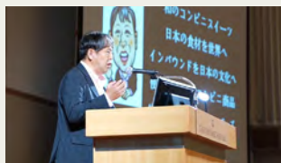
最新ニュースから見た日本経済の未来 コンビニを見たら日本経済がわかる