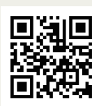
馬淵・渡辺の #ビジット Tokyofm