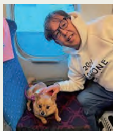
JR東海の特別イベント、 わんわんエクスプレスで 愛犬さくらと新大阪まで