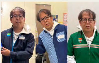
ローソン、ファミマ、セブンイレブン等 今でも年に数回、売場に立ちます